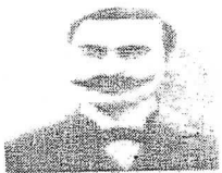
علي باش حانبة

أَسَّسَ الْإِتِّحَادَ الْعَامَ التُّونِسِيِّ لِلشَّغْلِ